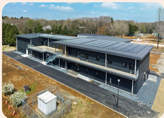
附属農場管理棟（外観）

大学構内の電気を 作る設備 (自家発電・太陽光発電)、 受ける設備 (受変電設備)、 送る設備 (電力ケーブル)、 使う設備 (照明・コンセント)から電気を 使って通信する設備 (火災報知・LAN等)まで 電気の通り道 となるものなら何でも取り扱っています