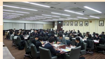
(昨年の座談会の様子)