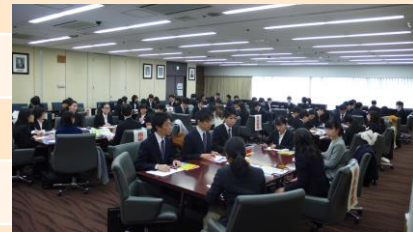
(昨年の座談会の様子)