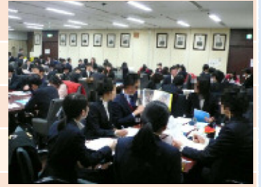
(昨年の座談会の様子)