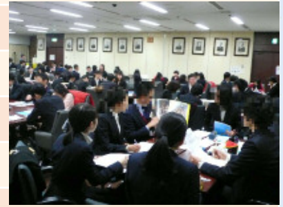
(昨年の座談会の様子)