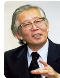
ノーベル化学賞2000 白川英樹 (名誉教授)