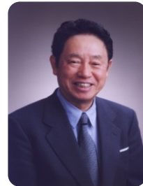
ノーベル物理学賞1973 江崎玲於奈 (元学長、名誉教授)