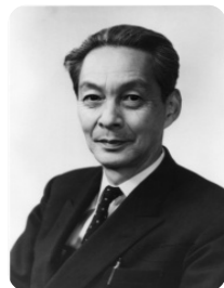
ノーベル物理学賞1965 朝永振一郎 (東京教育大学元学長、名誉教授)